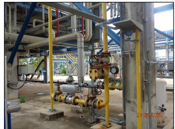
รูปที่ 3.53 Interlocks