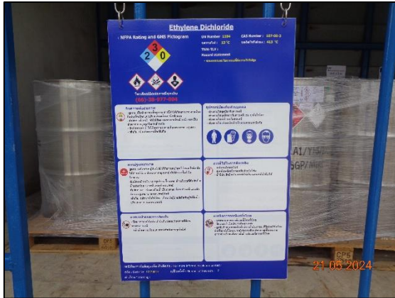
รูปที่ 3.32 ป้ายสัญลักษณ์แสดงความเป็นอันตราย ของสารเคมี (SDS)