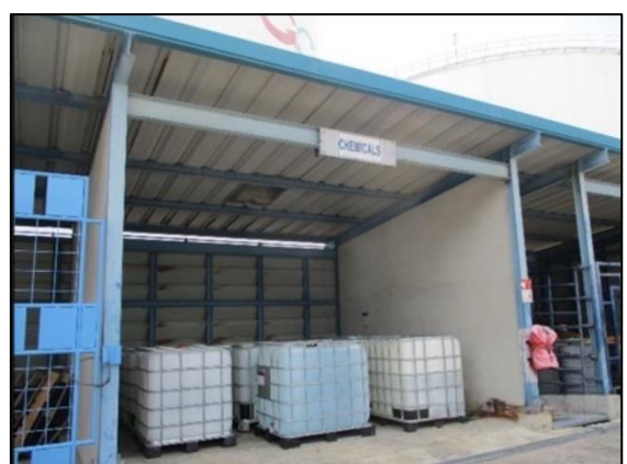
รูปที่ 3.13 พื้นที่กักเก็บป้องกันการรั่วซึมของ สารอันตรายระเหย