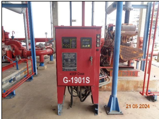
รูปที่ 3.56 เครื่องสูบน้ำดับเพลิง ชนิดเครื่องยนต์ดีเซล