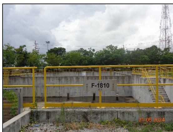
รูปที่ 3.60 บ่อ F-1810 รองรับการรั่วไหลของสารเคมี