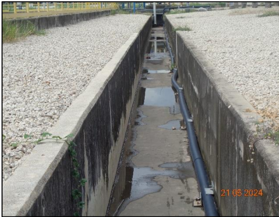
รูปที่ 3.20 รางระบายน้ำฝน