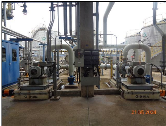
รูปที่ 3.50 Pump ชนิด Double Mechanical Seal