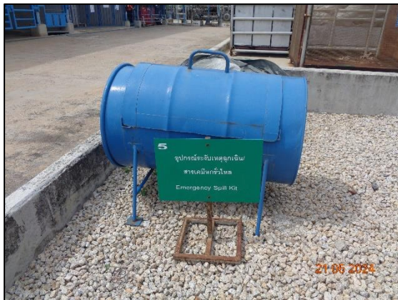
รูปที่ 3.8 ถังทลายดูดซับสารเคมี