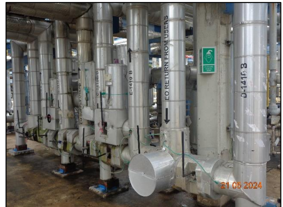
รูปที่ 3.35 อุปกรณ์ที่เกี่ยวข้องกับเอทิลีนออกไซด์ ที่ทำจาก Stainless Steel