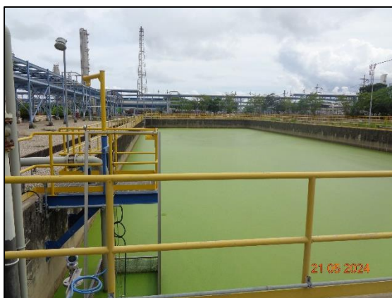
รูปที่ 3.12 Final Check Basin (F-1803)