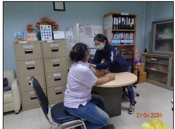
รูปที่ 3.29 ห้องพยาบาล