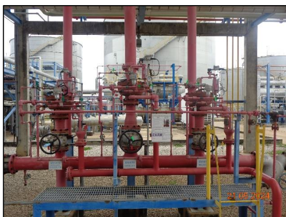
รูปที่ 3.42 Deluge System บริเวณถังเอทิลีนออกไซด์