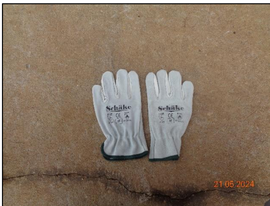
ถุงมือป้องกันสารเคมี