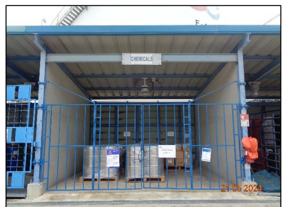
รูปที่ 3.7 อาคารจัดเก็บสารเคมี