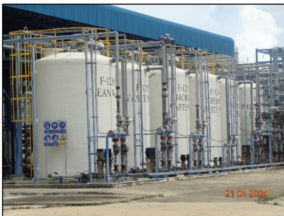
รูปที่ 3.10 หน่วยรีเวอร์สออสโมซิส