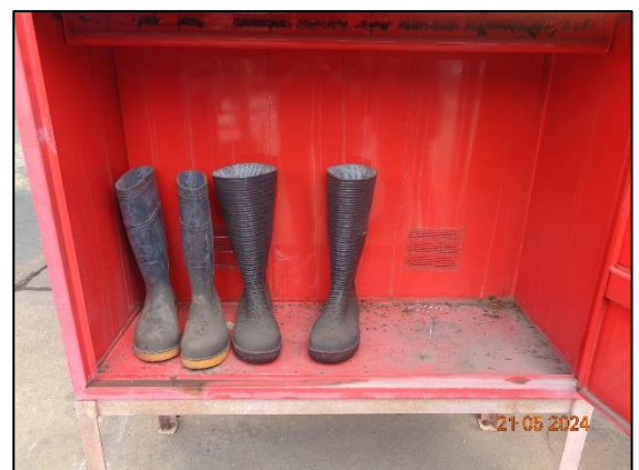
รองเท้าป้องกันสารเคมี