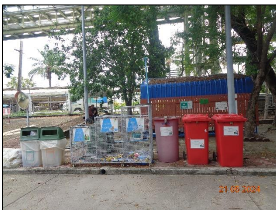
รูปที่ 3.24 ถังขยะแยกประเภท