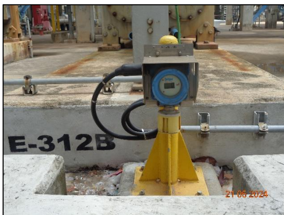
รูปที่ 3.54 Hydrocarbon Gas Detector