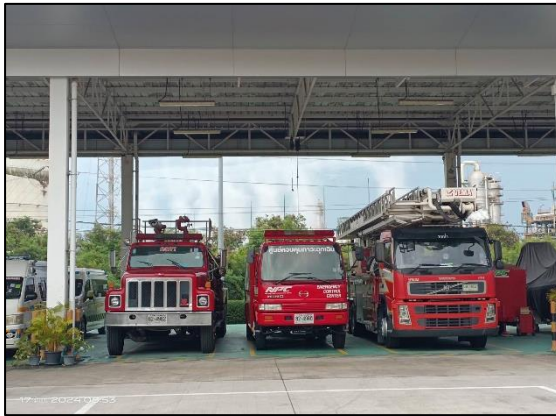
รูปที่ 3.26 รถดับเพลิง (จุดที่ บ. NPC S&E)