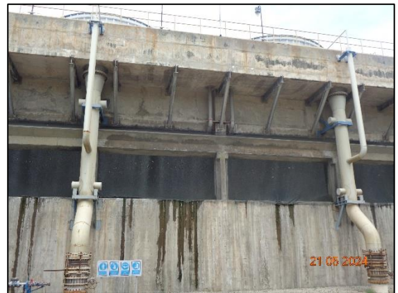
รูปที่ 3.11 Cooling Water Blowdown