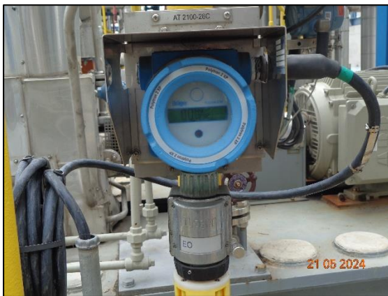
รูปที่ 3.52 Flammable Gas Detector