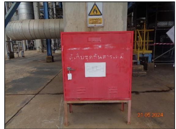
รูปที่ 3.23 ตู้จัดเก็บชุดกันสารเคมี บริเวณอาคารกักเก็บของเสีย