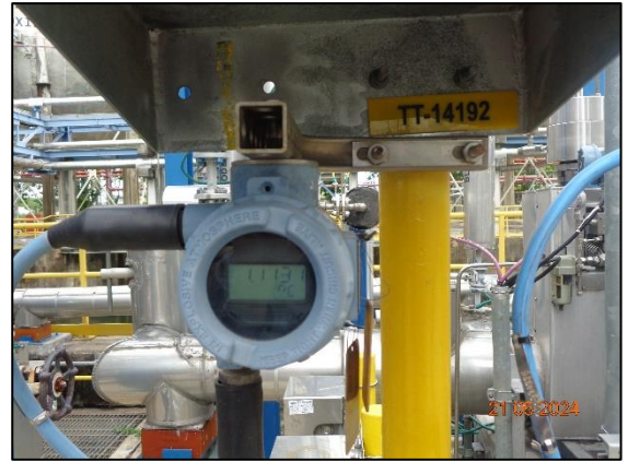
รูปที่ 3.51 High Temperature Interlocks