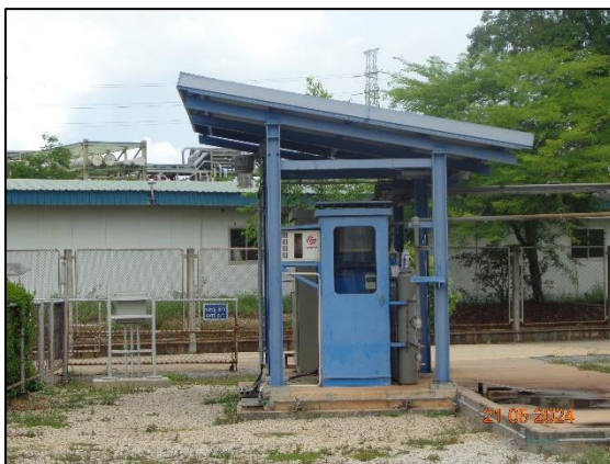
รูปที่ 3.2 CEMS ของปล่อง Waste Heat Boiler