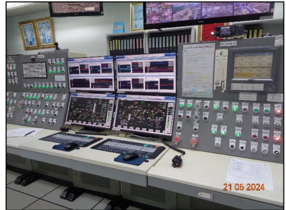
รูปที่ 3.39 ระบบ Distributed Control System (DCS)