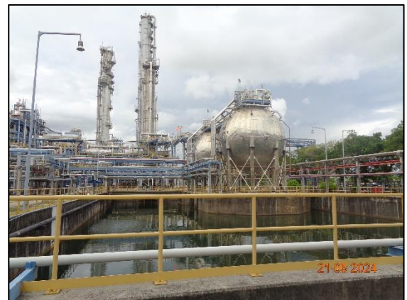
รูปที่ 3.41 EO Dilution Basin