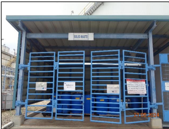
รูปที่ 3.22 อาคารรวบรวมกากของเสีย