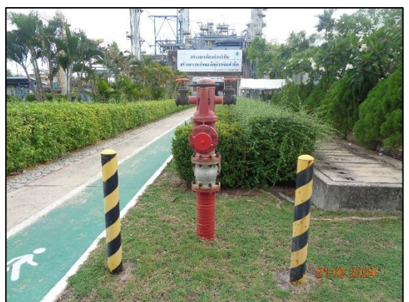
รูปที่ 3.43 Fire Water Monitor