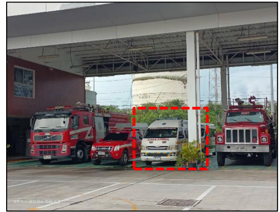
รูปที่ 3.27 รถพยาบาล (จุดที่ บ. NPC S&E)