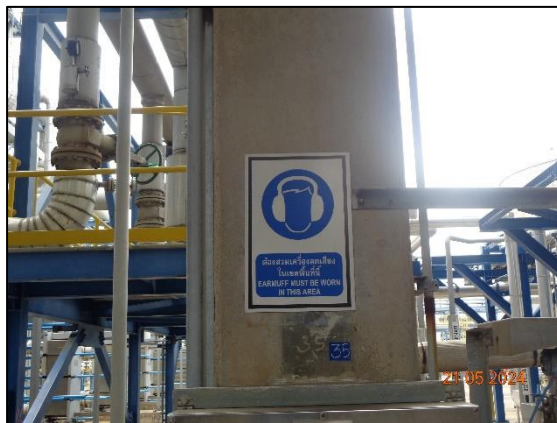
รูปที่ 3.16 ป้ายเตือนให้สวมใส่อุปกรณ์ลดเสียง