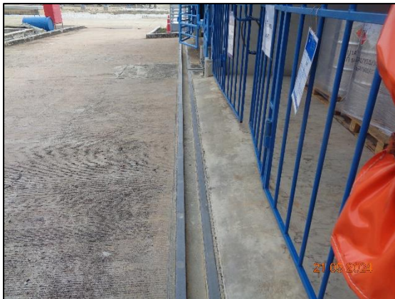
รูปที่ 3.34 ร่องระบายน้ำเพื่อป้องกันสารเคมีรั่วไหล