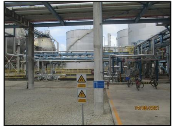
รูปที่ 3.33 ป้ายเตือนบริเวณถังเก็บสารเคมี