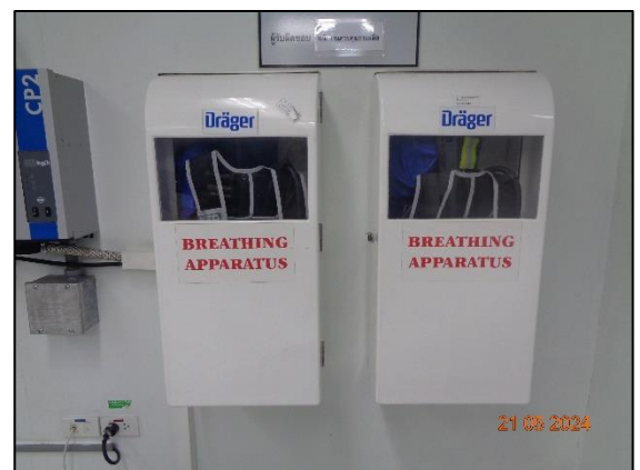
รูปที่ 3.25 Self Contained Breathing Apparatus (SCBA)