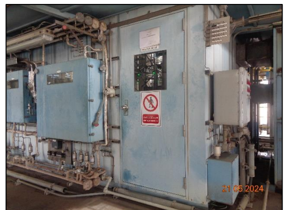
รูปที่ 3.31 บ้ายเตือนไม่ให้ผู้ที่ไม่เกี่ยวข้อง เข้า-ออกโดยไม่ได้รับอนุญาต