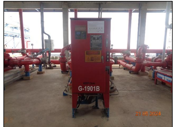
รูปที่ 3.57 เครื่องสูบน้ำดับเพลิง ชนิดไฟฟ้า