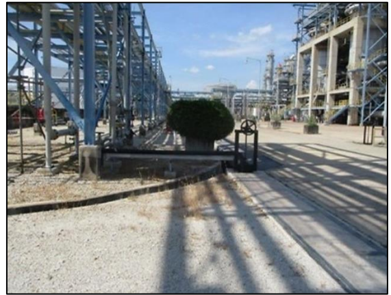
รูปที่ 3.21 Diversion Box