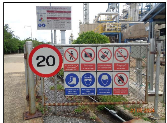
รูปที่ 3.17 ป้ายเตือนอันตราย บริเวณทางเข้า-ออกพื้นที่การผลิต