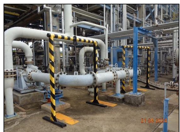
รูปที่ 3.37 Check Valve