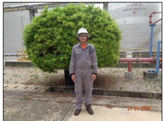
รูปที่ 3.15 พนักงานสวมใส่อุปกรณ์ คุ้มครองความปลอดภัยส่วนบุคคล