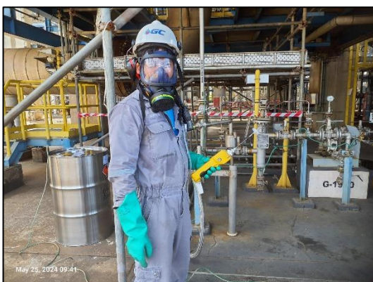
รูปที่ 3.6 การสูบบุหรี่สารเอทิลีนไดออกไซด์