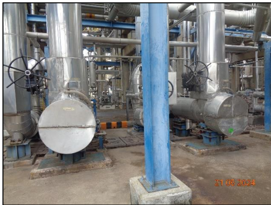
รูปที่ 3.14 Acoustic Insulation (G-624 A/B)