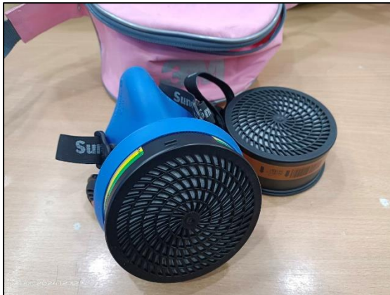
หน้ากากป้องกันสารเคมีเต็มหน้า