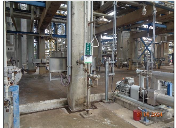
รูปที่ 3.47 Safety Shower