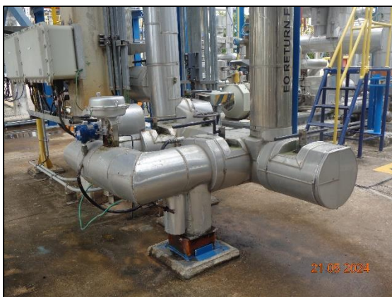
รูปที่ 3.36 ฉนวนหุ้มอุปกรณ์การผลิต เอทิลีนออกไซด์