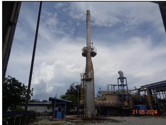
รูปที่ 3.1 Waste Heat Boiler