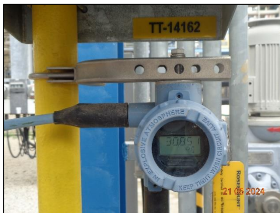
รูปที่ 3.40 Pressure/Temperature Indicator