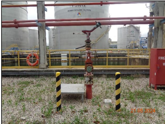
รูปที่ 3.44 Fire Water Hydrant