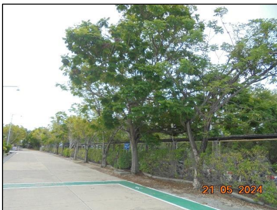
พื้นที่สีเขียวในปัจจุบัน