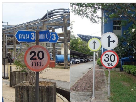
รูปที่ 3.18 ป้ายจำกัดความเร็วยานพาหนะ ในเขตพื้นที่หวงห้าม เช่น Process Area (20 กม./ชม.) และพื้นที่ควบคุม เช่น Warehouse (30 กม./ชม.)