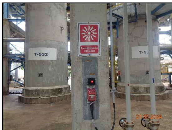
รูปที่ 3.46 Fire Alarm System