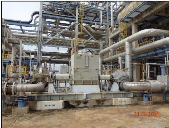
รูปที่ 3.38 ระบบระบายก๊าซ (Relief Valve R-150)