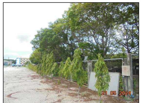
พื้นที่สีเขียวที่ปลูกเพิ่มเติม