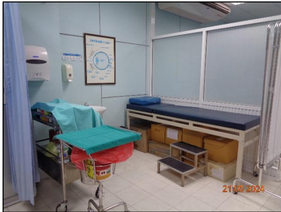
รูปที่ 3.28 อุปกรณ์ปฐมพยาบาล