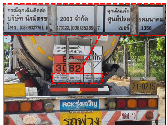
รูปที่ 3.19 ป้ายสารเคมี และเบอร์โทรศัพท์รถขนส่ง