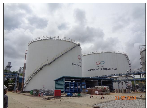
รูปที่ 3.55 ถังน้ำสำรองดับเพลิง