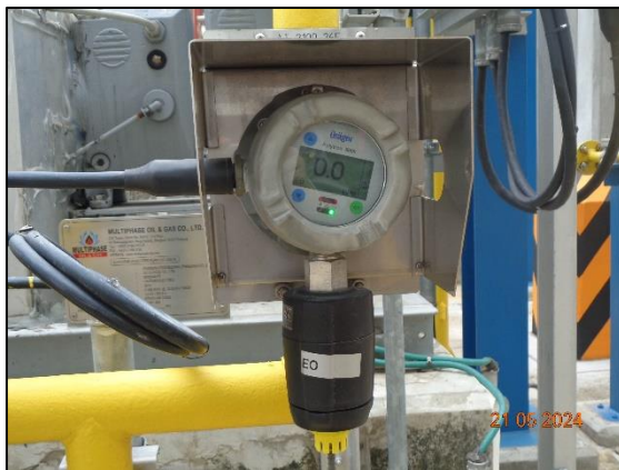
รูปที่ 3.30 เครื่องตรวจวัดก๊าซเอทิลีนออกไซด์