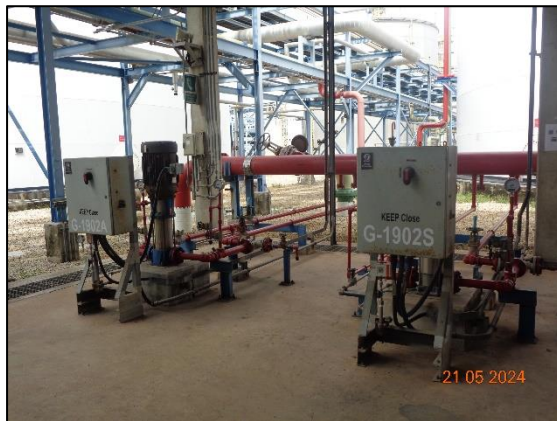
รูปที่ 3.58 เครื่องสูบน้ำดับเพลิงรักษาแรงดัน