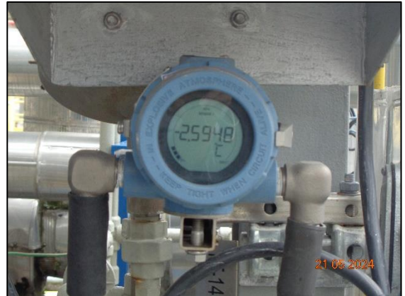
รูปที่ 3.45 เครื่องตรวจวัดอุณหภูมิ บริเวณถังเก็บเอทิลีนออกไซด์