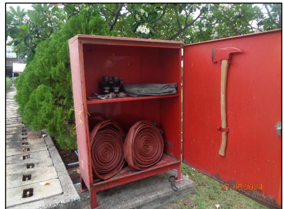
รูปที่ 3.59 ตู้เก็บอุปกรณ์ดับเพลิง