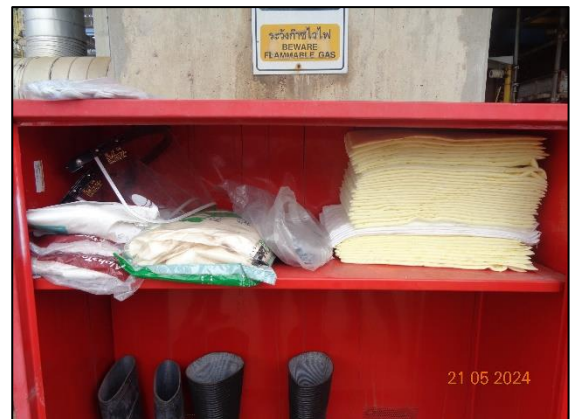
ชุดกันสารเคมีระดับ C