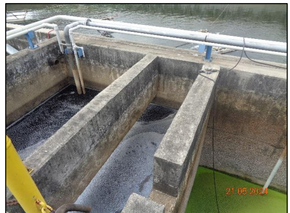
รูปที่ 3.9 Wastewater Holding Pit (F-1801)