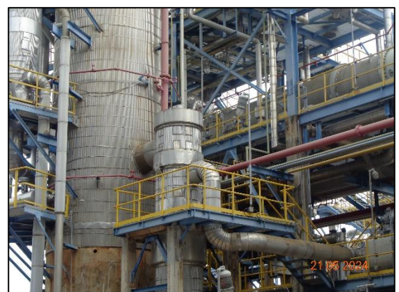
รูปที่ 3.49 Tower Bottom Stream