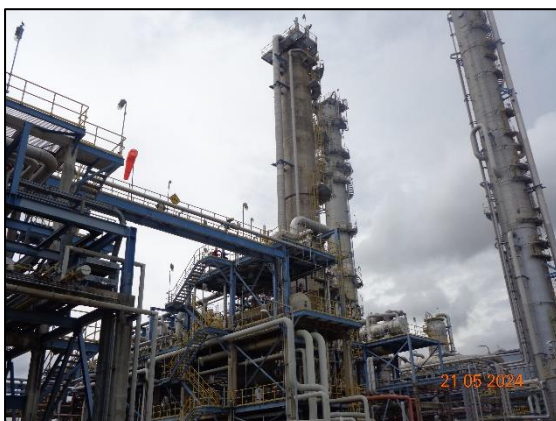
รูปที่ 3.48 ระบบพ่นน้ำล้างบนหอกลั่น